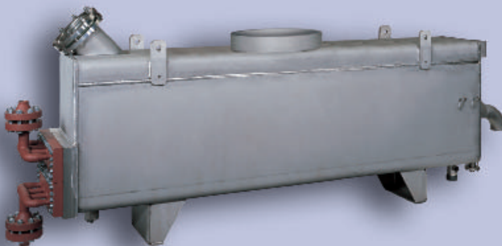
Финальный нагреватель VHE

Предназначен для дезодорации и физической рафинации жиров и масел